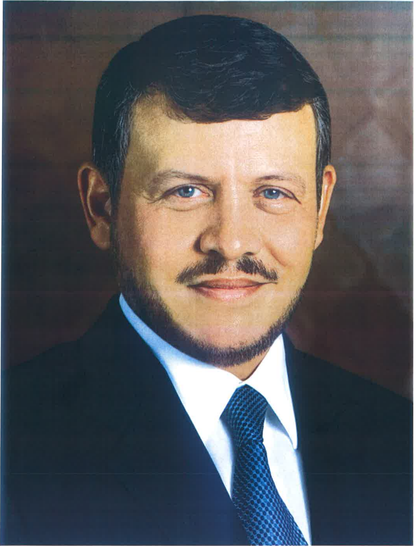
حضرة صاحب الجلالة الهاشمية الملك عبد الله الثاني بن الحسين المعظم